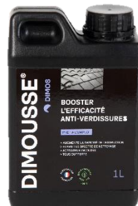
Ref. 444 180 DIMOUSSE Solution booster anti-verdissures