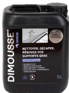
Ref. 444 170 DIMOUSSE Dégraissant concentré