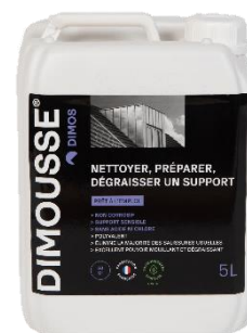
Ref. 444 160 DIMOUSSE Clean 2 en 1