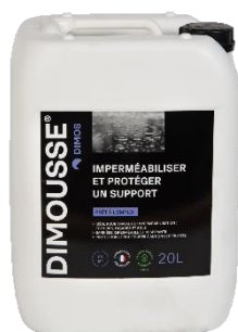
Ref. 444 150 DIMOUSSE Hydro