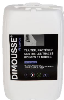
Ref. 444 130 DIMOUSSE Algues

Nos produits compatibles DIMOUSSE 2.0 Prêt à l'emploi anti-verdissures: